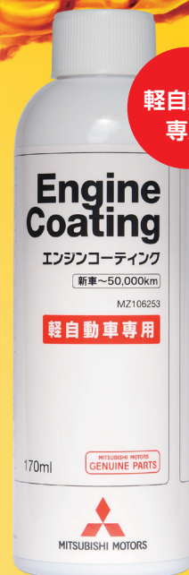
軽自動車専用 エンジンコーティング