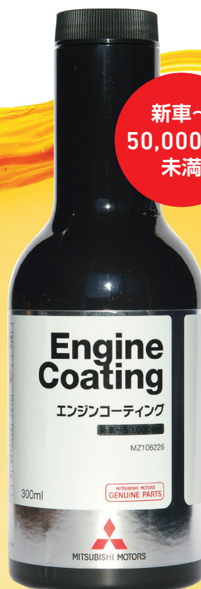
エンジンコーティング