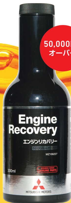
エンジンリカバリー