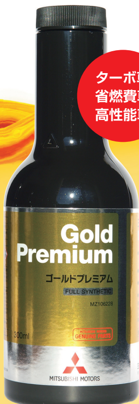
ゴールドプレミアム