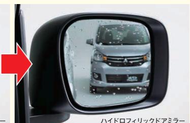
ハイドロフィリックドアミラー