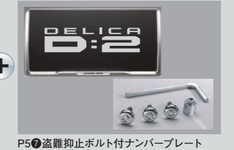
P5盗難抑止ボルト付ナンバープレートフレーム(メッキ)パッケージ