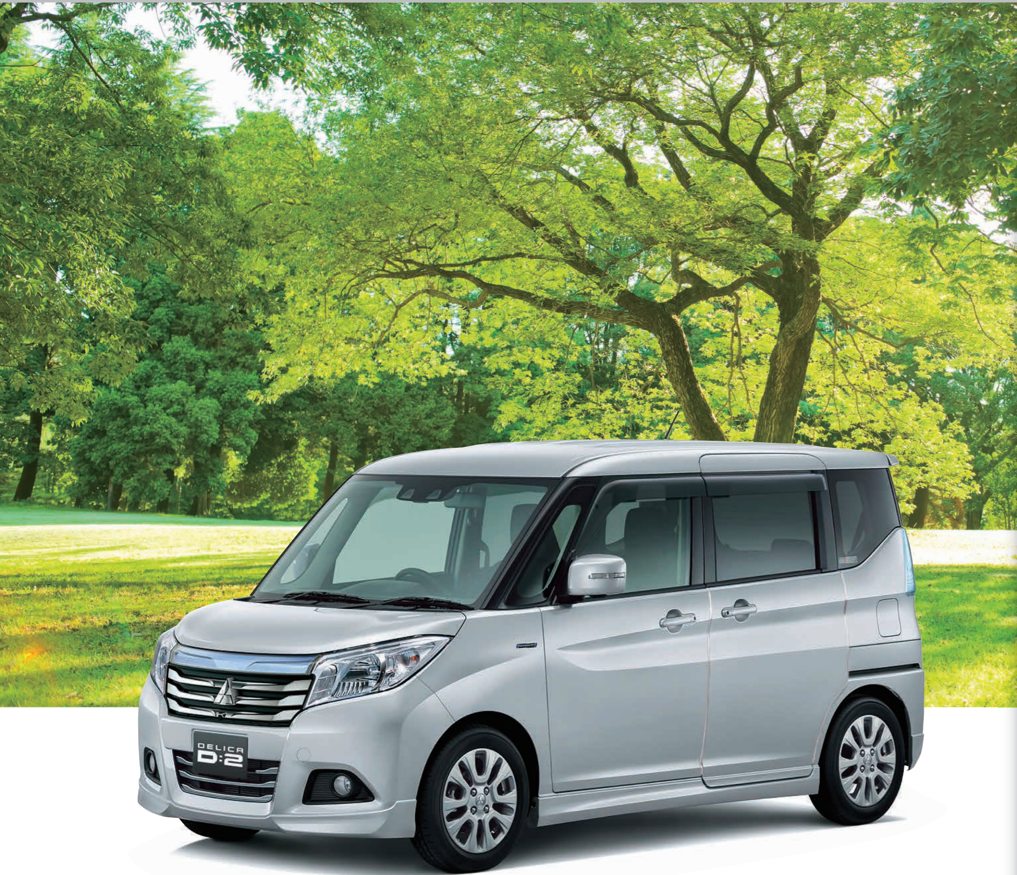
ベース車：HYBRID MZ <装着用品>L型バイザー、ドアエッジモール