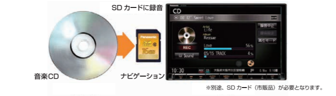
※別途、SDカード(市販品)が必要となります。

CDの楽曲を最大約8倍速でSDカード(市販品)に録音が可能。5段階の圧縮録音モードが選択でき、高音質重視320kbpsから曲数を重視した96kbpsまで選ぶことができます。また、地上デジタル放送など他のAVソースを視聴しながらCDを録音することも可能です。