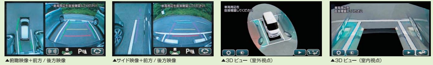
▲俯瞰映像+前方/後方映像 ▲サイド映像+前方/後方映像 ▲3Dビュー(室外視点) ▲3Dビュー(室内視点)

「全方位モニター用カメラパッケージ装着車」には、クルマの前後左右に4つのカメラを設置しています。これに三菱自動車純正の対応ナビゲーションを組み合わせれば、クルマを真上から見たような映像などを映し出せる「全方位モニター」になります。また、見通しの悪い場所で人などが近づくとお知らせする「左右確認サポート機能」も前後に装備。運転席から見えにくい周辺状況の確認をサポートします。