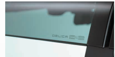
DELICA D:2 ロゴ (フロントバイザー部)