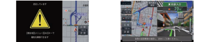
※全ての逆走の検知・注意喚起を保障するものではありません。 ※状況によって検知・注意喚起の内容が異なります。

逆走検知機能 高速道路の入口、ジャンクション、インターチェンジ、SA・PAの本線合流部での逆走を検知し、画面表示と音声で警告します。 逆走注意喚起機能 高速道路進入時やSA・PAでの駐車後の発進時などに、画面表示と音声で注意喚起します。