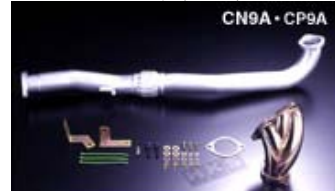
GTエクステンション