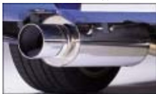
サイレントハイパワー