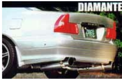
ダブル出しの参考写真です。