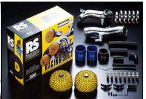
HKS RACING SUCTION