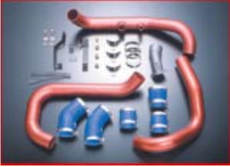
RAインタークーラーパイピングキット例