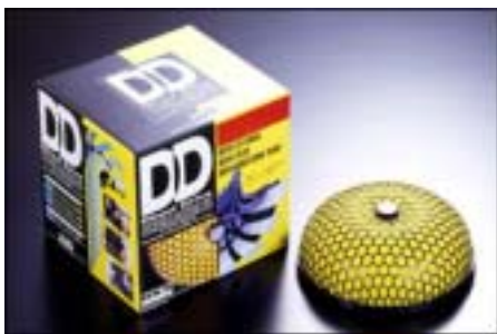
HKS SUPER POWER FLOW D D