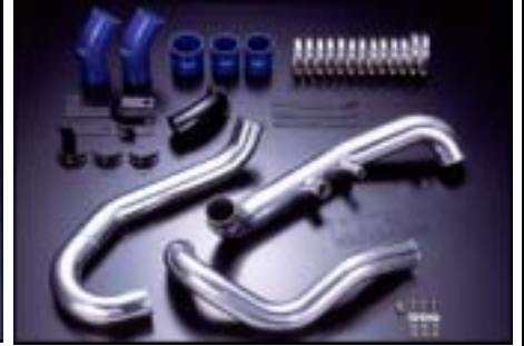
HKSインタークーラーパイピングキット例

詳細につきましてはRALLIART 及びHKS WEBを参照願います。( http://www.ralliart.co.jp & http://www.hks-power.co.jp )