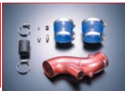
RAエアサクシ-ンパイプキット例