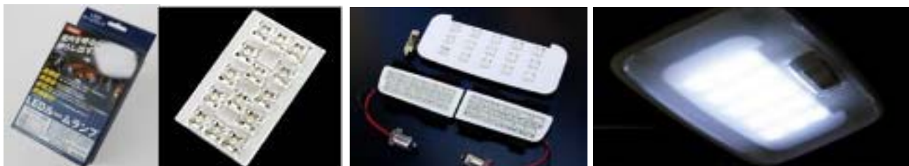
参考画像 (取付車種により形状が相違します。)