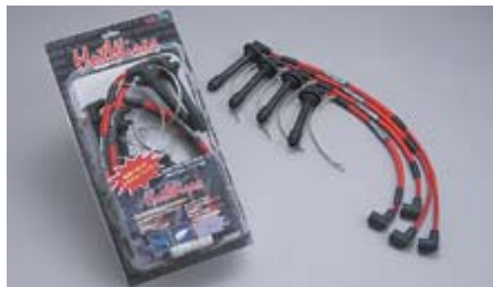
ホットワイヤー・レッドカラー