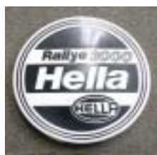
別売りストーンガード