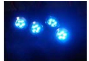
フットイルミネーション