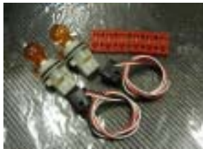
ウインカー&ポジションバルブセット