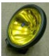
HELLAラリー3000(ランプ&キャップ)