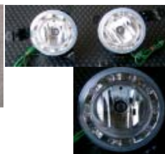
TRITON フォグランプセット