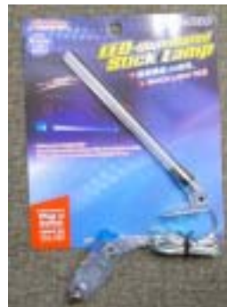
スティックランプ