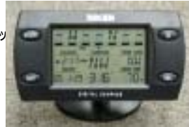
デジタルコンパス