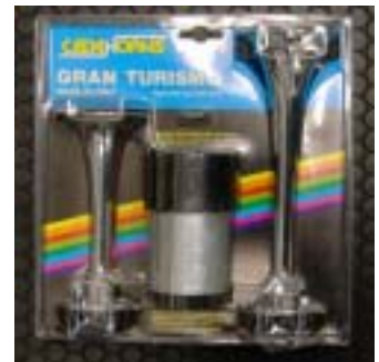
CEDA エレクトロエヤーホーン