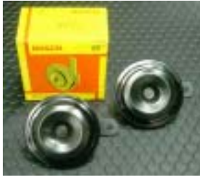
BOSH コンパクトホーン