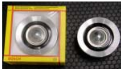
BOSH ヨーロッパホーン