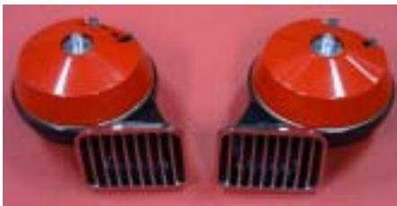
RDB エレクトロホーン