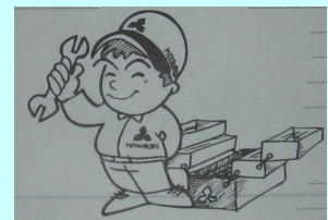
一冊はほしいな自分の車のカタログ