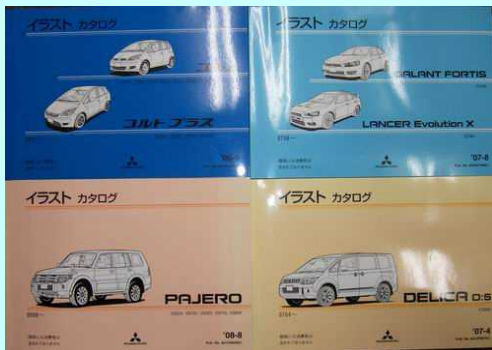
車種別イラストカタログです。

部品番号等検索用電子パーツカタログ等は、非公開となっておりますが、弊社、店頭にて、お客様自身にて検索できます。また下記のイラストカタログ等は、購入可能ですので、ご購入希望の場合は問合せ願います。