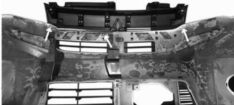
・バンパー裏側から見た図

*下図の白矢印に示すネジ(3箇所)以外はハメ込みです。裏側からマイナスドライバーなどでツメの引っ掛かりを外すように押してハメ込みを外します。