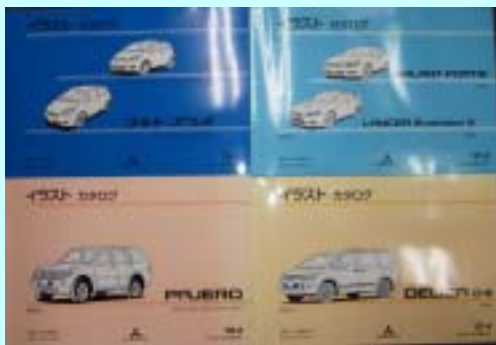
車種別イラストカタログです。

部品番号等検索用電子パーツカタログ等は、非公開になっておりますが、弊社、店頭PCにて、お客様自身にて検索できます。 また下記のイラストカタログ等は、購入可能ですので、ご購入希望の場合は問合せ願います。