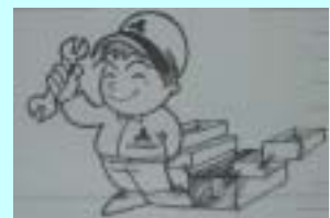
一冊はほしいな自分の車のカタログ