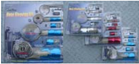
ダミーメッシュスリーブセット