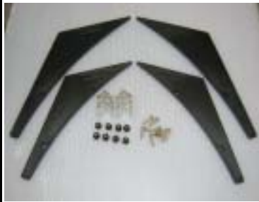
汎用フラットカナード