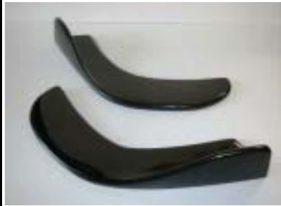
汎用成形品カナード