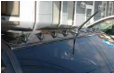
純正 & 市販ボルテックスジェネレーター装着例