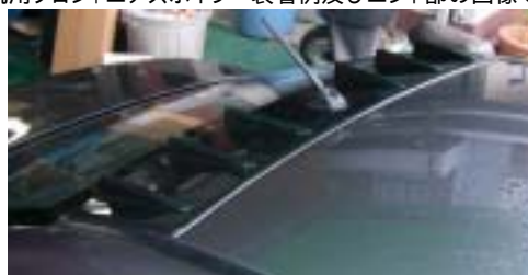
市販ボルテックスジェネレーター ギャランFortis装着例