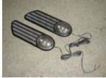
画像(F) 汎用ダミーダクトLED付