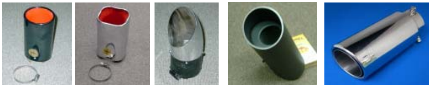
楕円型ブラック 角型クローム ベンド型 アルミソリッド型 RAタイ製