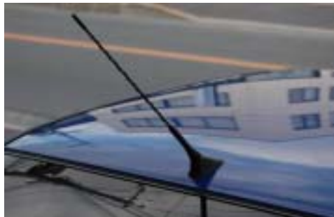
ロングアンテナ装着例