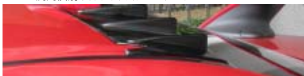
Evo-X装着の場合加工が必要です。