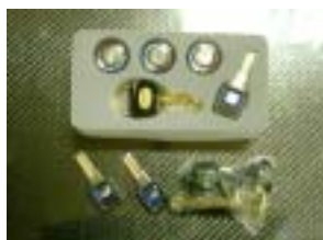
ディンプルキー型