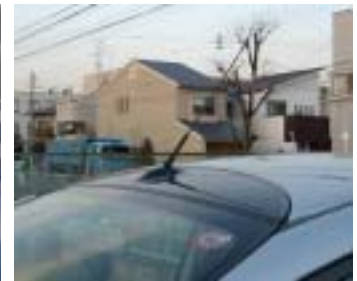
アイにも装着可能です。