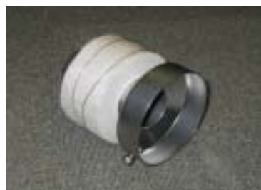
市販マフラー用(消音部材のみ)

この部品を付ける事によって、保安基準に適合するものではありません。装着車の音量を軽減する事が目的です。